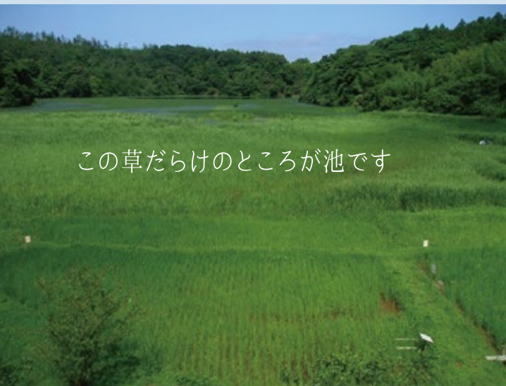
この草だらけのところが池です

この小さな浅い池には、夏の間水草が生い茂ります。これを放置すると秋には枯れてどんどん池の中に溜まり、池が埋まって陸地化してしまいます。藩政時代から続く野鳥たちの楽園を、未来につなげるためのお手伝いをしていただけませんか？