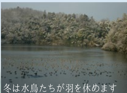
冬は水鳥たちが羽を休めます

この小さな浅い池には、夏の間水草が生い茂ります。これを放置すると秋には枯れてどんどん池の中に溜まり、池が埋まって陸地化してしまいます。藩政時代から続く野鳥たちの楽園を、未来につなげるためのお手伝いをしていただけませんか？