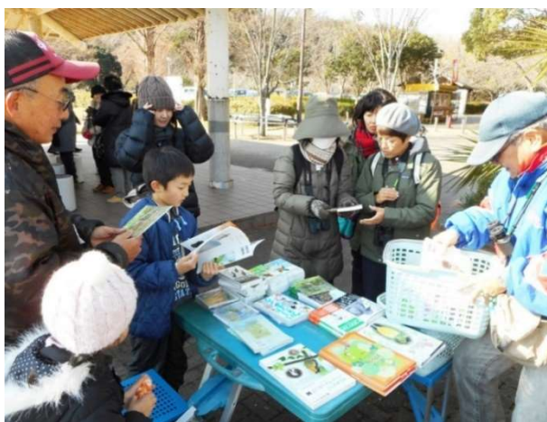
▲連携団体での販売の様子（日本野鳥の会遠江の探鳥会にて）

販売を通じてバードウォッチングの輪が広まるとともに、その販売収益が連携団体の活動の一助となれば幸いです。