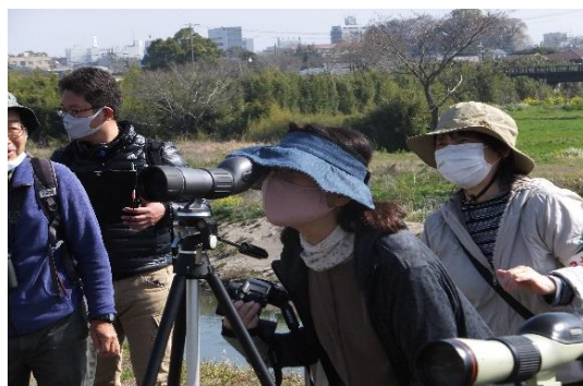
▲初めての望遠鏡に興奮の参加者

3/14の野外観察会では、受付で参加者に体温測定や手指消毒、マスクの着用確認を実施。総合案内役の中原会員の引率でグループに分かれて観察がスタートしました。早速、「カワセミ」があらわれ、あちこちで歓声があがります。川向こうには菜の花畑が広がり、揚げヒバリの囀り。道中で目に入った鳥は、スタッフが図鑑で説明しました。下流の橋の下には冬鳥の「ヒドリガモ」の集団。終了前にはオオタカの飛翔が観察でき参加者は大満足でした。