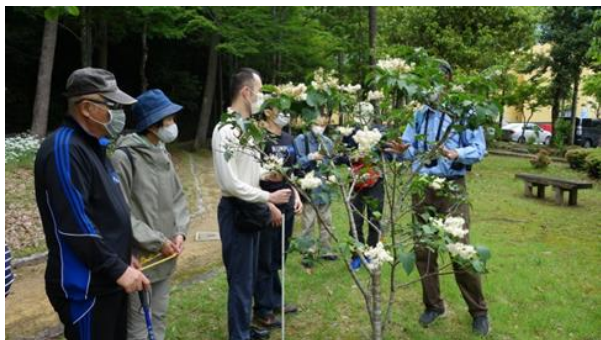
▲アワブキの花の香りを嗅ぐ

風が強く、鳥の声はやや遠いと感じられましたが、雨の心配をすることなくゆっくり散策できました。鳥の声だけでなく、風で樹がきしむ音も聞こえ、花の香り、樹木の感触なども体感してもらいながら、野外の散策や初めてのバードリスニングを楽しんでもらいました。