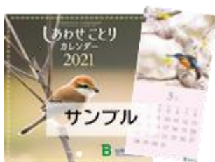
小さな壁掛けタイプ (使用時約 30×15cm)

※カレンダープレゼントは、2021年1月～現時点でご入会済みの方も対象となります。 ※プレゼントは予告なく変更、終了させていただくことがあります。ご了承ください。