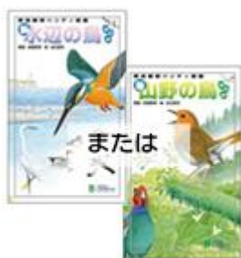
厚さ約5mm。ポケットサイズの初心者向け図鑑