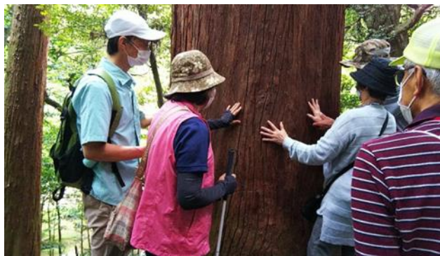
▲杉の木の幹を触る