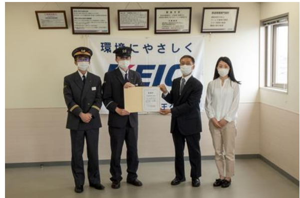
▲5/31 京王電鉄株式会社への贈呈の様子 (当会副理事長より贈呈)

https://www.wbsj.org/activity/press-releases/press-2021-06-03/