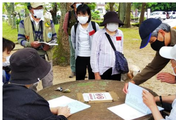
▲さわる図鑑で点字を読む