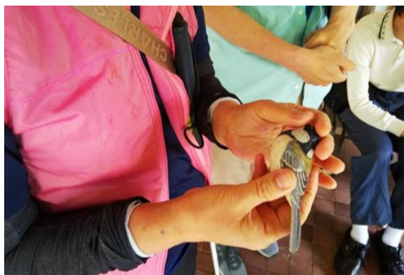
▲実物大模型（シジュウカラ）を触る