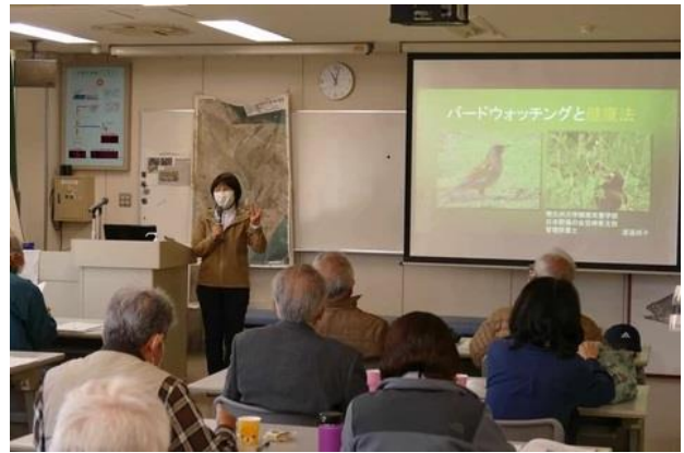
▲野鳥観察と健康法について説明

今回初めて紹介された「バードウォッチングと健康法」では、野鳥観察行動は心身のストレス解消や免疫力アップ、人との交流による認知症のリスク低減につながるなどの話や、持続可能な活動に欠かせない食事や栄養管理についても解説があり参加者が熱心に聞き入っていました。