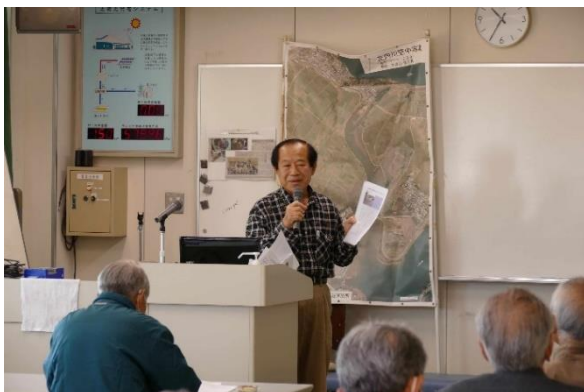
▲延岡周辺の観察スポットの紹介