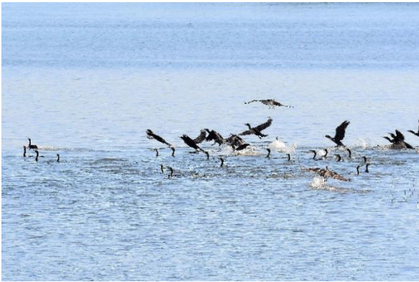
▲カワウの追込み漁

にぎやかな観察と鳥合せ作業を全員で行い、終了後のアンケートでは野鳥とのふれあいで宮崎の自然を再認識したと、宮崎県支部と南九州大学の取組みに感謝のコメントが寄せられました。