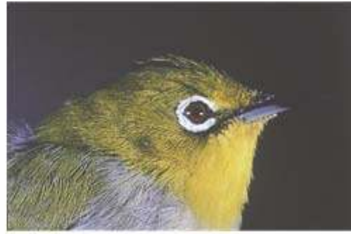
中国産ヒメメジロ

国内で違法に密猟した日本産メジロを、輸入鳥と偽る悪質な業者を長く取り締まることができなかった。しかし、中国産は亜種ヒメメジロで、日本産のメジロとは翼長が小さいことなどから識別が可能であることが遠藤さんの指摘で判明し、メジロの密猟問題は大きく進展した