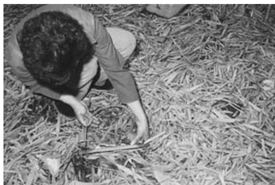
ワナにかかったオオルリ。広州市で