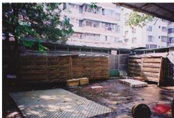
約3千羽のヒメメジロのかご。