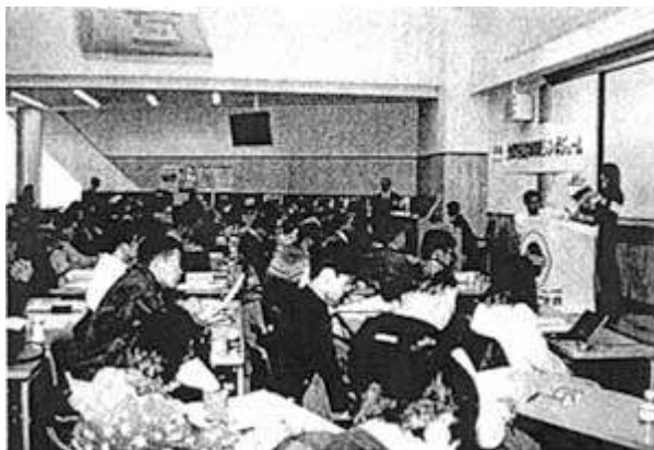
シンポジウムの参加者は 140 名を超え、 野鳥の違法販売や輸入規制について討議が行われた