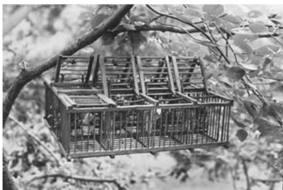
ヒメメジロを捕る落としかご。広州市で

2001年6月から、中国から日本への野鳥の輸出はついに止まった。しかし、日本の業者はそれは鳥インフルエンザ発生に伴う検疫の強化のせいで、流行がやめば輸入を再開するという。(編集参注)