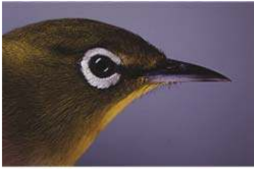
日本産メジロ〔亜種メジロ〕