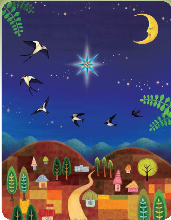
Illustration: Yumiko Fujii

あれから元気な暮らしているのでしょうか？ いつもやさしく迎えてくれるおばあちゃんは