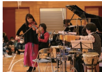
南相馬市小学校でのコンサート