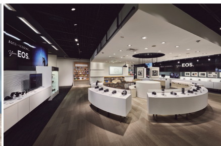
フォトハウス銀座