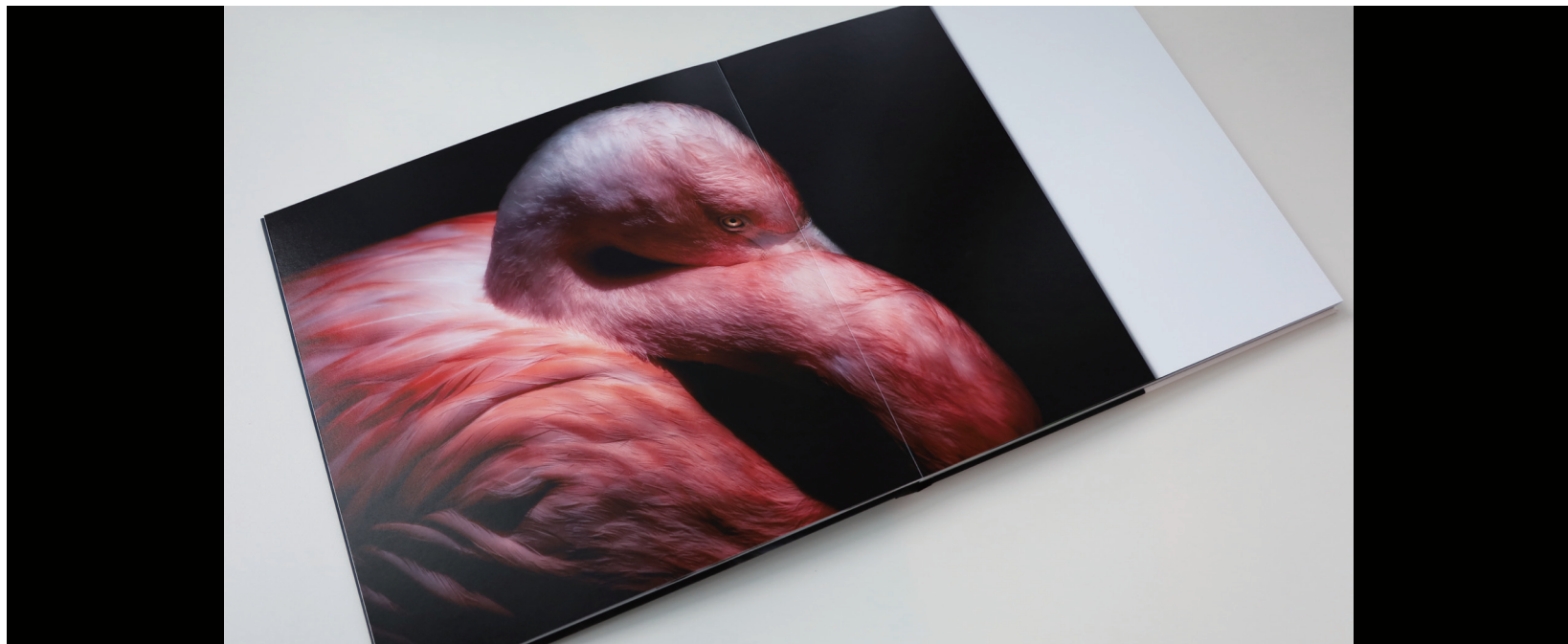
PhotoJewel S 30cmスクエア/レイフラット/ラスター/40P

PhotoJewel Sは、高品質で高級感のある仕上がりの写真集が作れるフォトブックサービスです。 こだわりの製本・用紙と豊富なサイズから選べ、背景変更や文字挿入はもちろん、高度な編集機能で自在にカスタマイズできます。 これまで撮りためた野鳥写真を、こだわりの写真集に仕上げてみませんか。 パソコンやタブレット、スマートフォンにアプリケーションをダウンロードすれば、気軽に始められます。