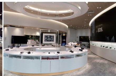
フォトハウス大阪