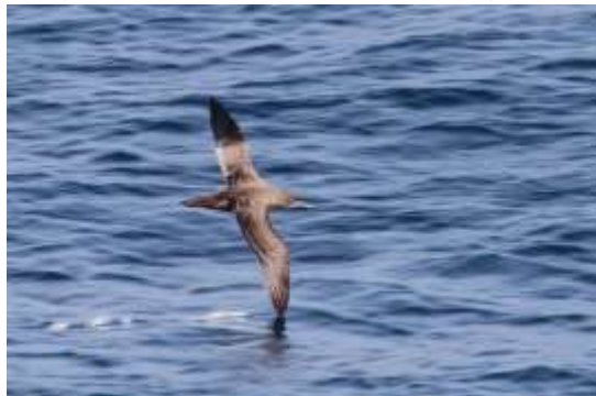
写真⑤ ハイイロミズナギドリ 能代市沖