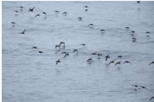
写真③ ハシボソミズナギドリの群 能代市沖