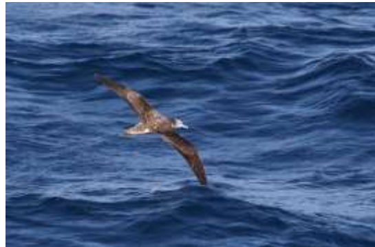
写真④ オオミズナギドリ 能代市沖