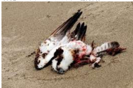
写真⑦ 2018年4月ミサゴ 由利本荘市