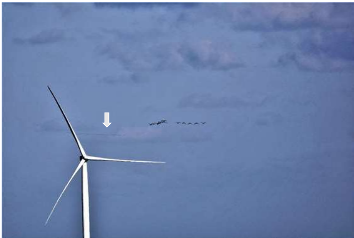
写真① 2020年3月7日 海岸沿いの八峰風力発電所奥の洋上をガンの群が飛んでいる