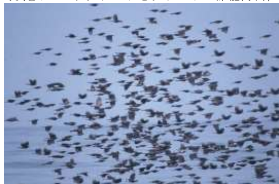
写真⑧ 飛島航路洋上のヒヨドリの群