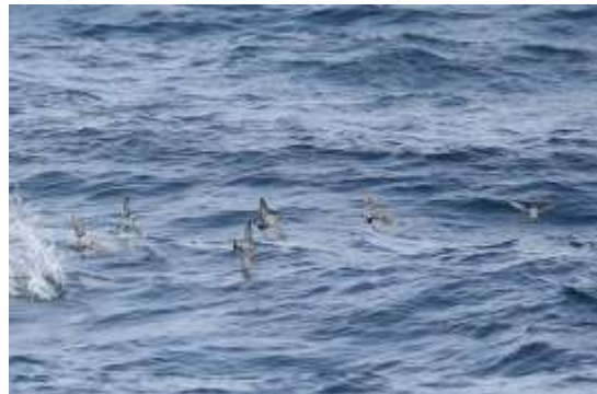
写真⑥ カンムリウミスズメとウミスズメの群 能代市沖