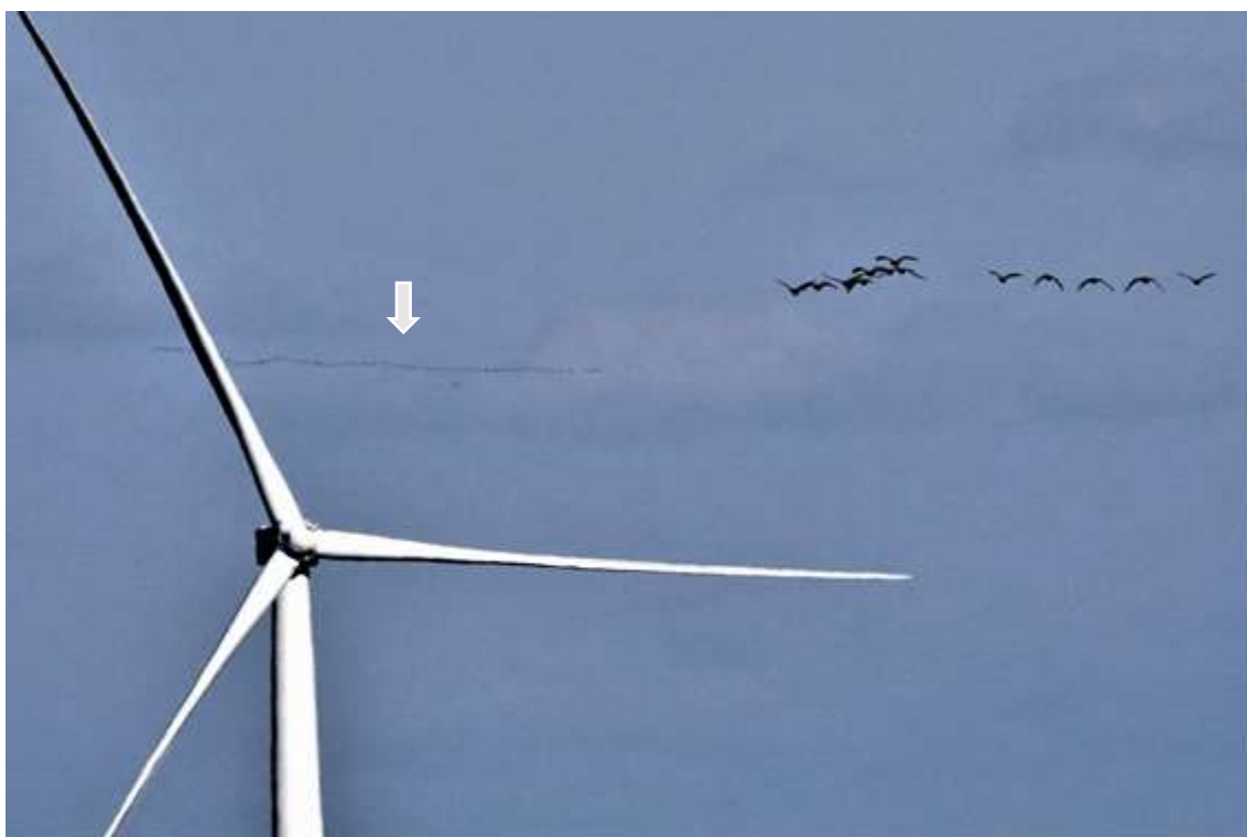
写真② 写真①の拡大図