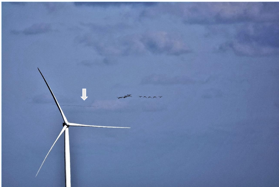
写真① 2020年3月7日 海岸沿いの八峰風力発電所奥の洋上をガンの群が飛んでいる