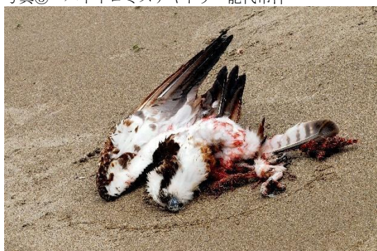
写真⑦ 2018年4月ミサゴ 由利本荘市