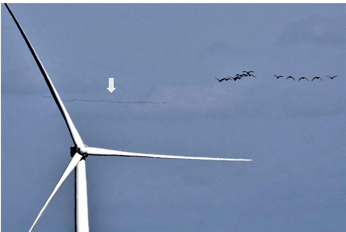
写真② 写真①の拡大図