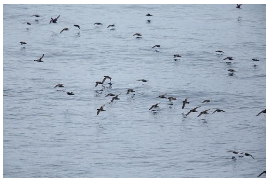
写真③ ハシボソミズナギドリの群 能代市沖