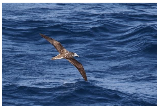
写真④ オオミズナギドリ 能代市沖