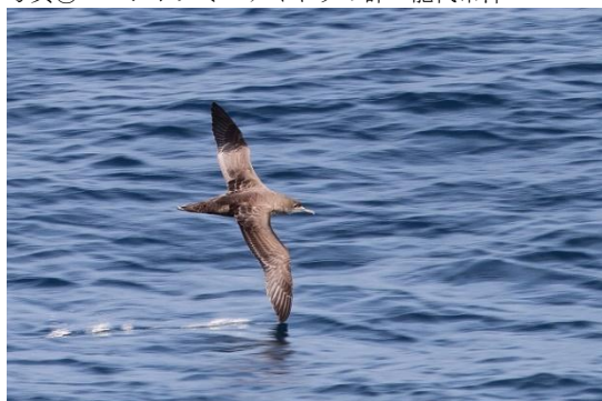
写真⑤ ハイイロミズナギドリ 能代市沖