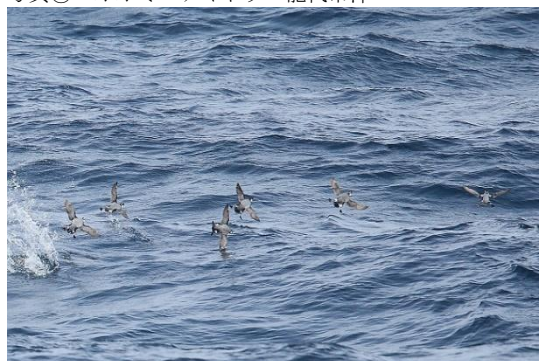
写真⑥ カンムリウミスズメとウミスズメの群 能代市沖