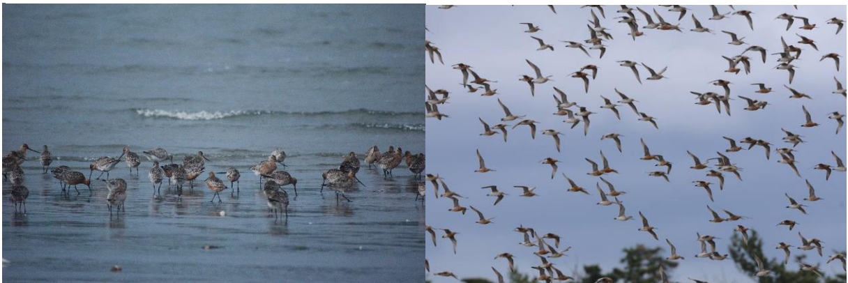
① 船越海岸 2009年5月12日