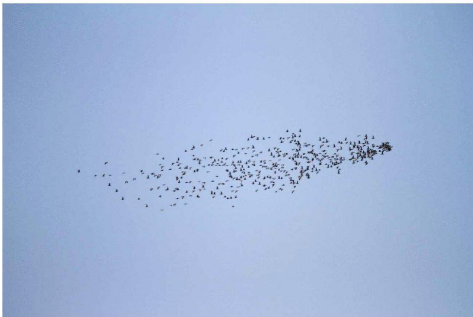
写真③④ 2019年4月28日青森県つがる市出来島で観察されたオオソリハシシギ 日本野鳥の会弘前県支部 柏木敦士氏 「2019年度 津軽地方のシギ・チドリ類 生息状況調査報告書」 (日本野鳥の会弘前支部蔵) より