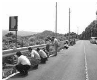
押収された野鳥を放鳥

飼育・販売されていたメジロについては、環境省の委託で（財）山階鳥類研究所が行った調査研究により、国産か輸入かの識別ができるようになり、それに基づいて違法性が証明できます。そこで、こうした識別経験の深い、環境省の標識調査員（バンダー）の方をあらかじめ密対連から紹介してもらった警察は、当日この方に計測・鑑定を依頼し、密猟者宅の 1羽および小鳥店の 59羽