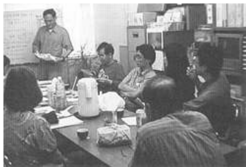
東京支部と、共同小鳥店調査に向けて事前打ち合わせ

今回の調査では、日本産と同種の野鳥は、94種、2,786羽で、販売羽数が最も多かったのは2000年、2001年の調査結果と同様にメジロで1,066羽でした。次いでホオジロの346羽でした。この上位2種は、許可を得れば1世帯あたりどちらか1羽までペットとして飼うことが認められています。特にメジロについては、鳴き声を競わせる「鳴き合わせ会」というものがあり、市場での需要が多いようです。東京支部と自然保護室が合同で行った都内のペットショップでの調査では、明らかに国産メジロと思われるものが違法販売されていました。