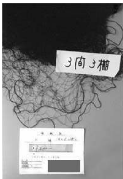
「¥2,000 円、本物のカスミ網だよ」と店主がくれた領収書

置いてあった。ふと気がつくと、ほこりを被った陳列ケースの中の網らしいものが目にとまった。「アッ、網がある」の言葉に対し「防鳥網というんだよ。でも本物のカスミ網だけどネ」と店主。