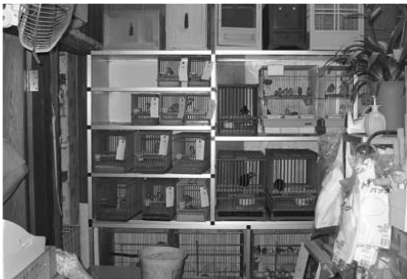
小鳥店の奥に入ると、鳥かごに入れられた野鳥たちが売られていた

愛知県内のテレビ局、新聞社による取材後、押収された野鳥のうち、元気ですぐ放せるものは近くの山林に放鳥しました。渡り鳥、幼鳥および飛べない鳥については、一時野鳥園の施設で保護して後日、然るべき時に放鳥することになりました。