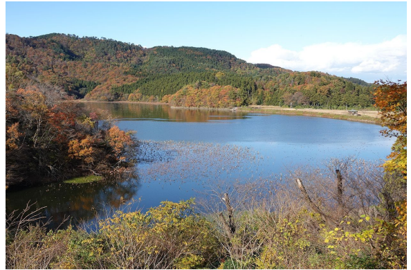
ラムサール条約湿地の大山上池・下池。 写真は下池。

参考: https://www.env.go.jp/nature/ramsar/conv/ramsarleaflet/19_Oyama_Kami-ike_and_Shimo-ike.pdf