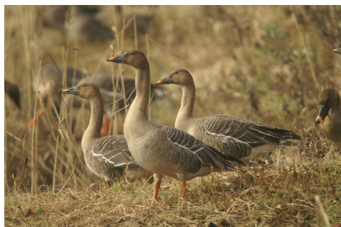
オオヒシクイ

( https://www.city.tsuruoka.lg.jp/seibi/kankyo/recycleenergy/kankyo20221220.files/2022.12.pdf 、2023年8月4日確認)